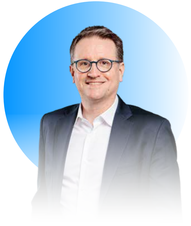
Rodolphe Belmer Vorstandsvorsitzender der Atos SE

Durch die Prinzipien des Ethikkodex schaffen wir das Vertrauen, auf dem unser zukünftiger Erfolg beruht. Das General Management Committee verlangt von jedem einzelnen Beschäftigten, sich zu diesem Ethikkodex zu verpflichten und sicherzustellen, dass sich auch alle Beteiligten daranhalten.