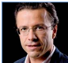
Excmo. Sr. D. Javier Fernández-Lasquetty Consejero de Sanidad COMUNIDAD DE MADRID

Madrid, 26 de enero de 2011 - Hotel Holiday Inn