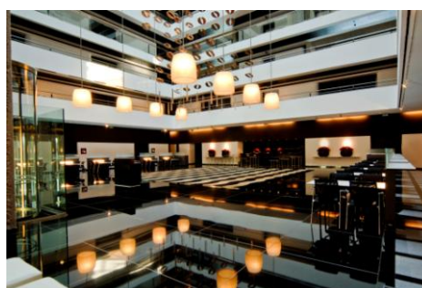
Sala de Expositores