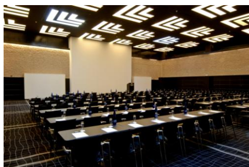
Salon Conferencias plenarias